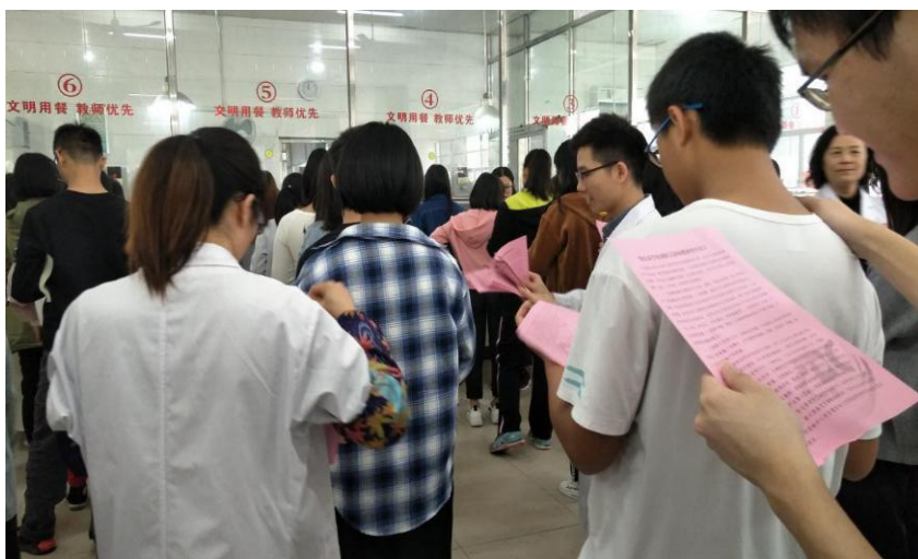
防艾宣传活动现场图