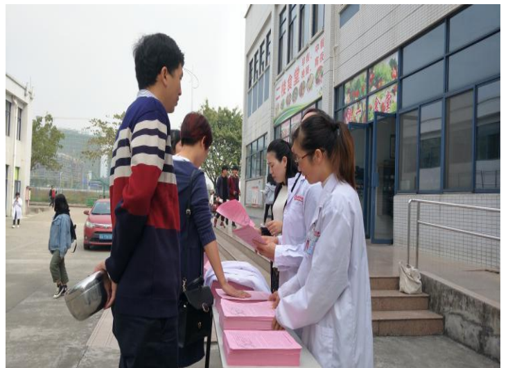
防艾宣传活动现场图